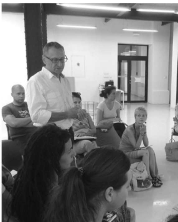
Veľká porada deň pred otvorením. Všetko musí byť dotiahnuté do detailov. Hlavná téma: slávnostný ceremoniál.