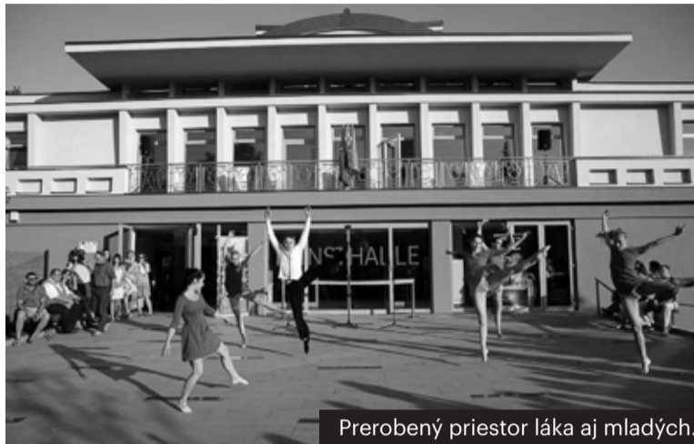
Prerobený priestor láka aj mladých.

Budova je jedným zo symbolov starých Košíc, dodnes robí radosť