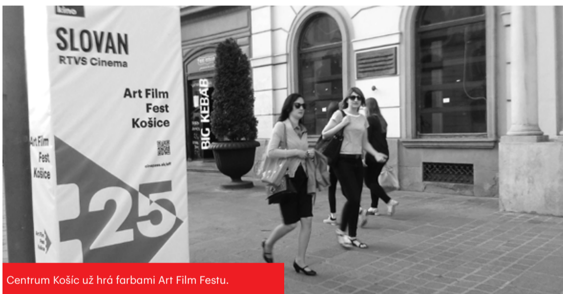
Centrum Košíc už hrá farbami Art Film Festu.