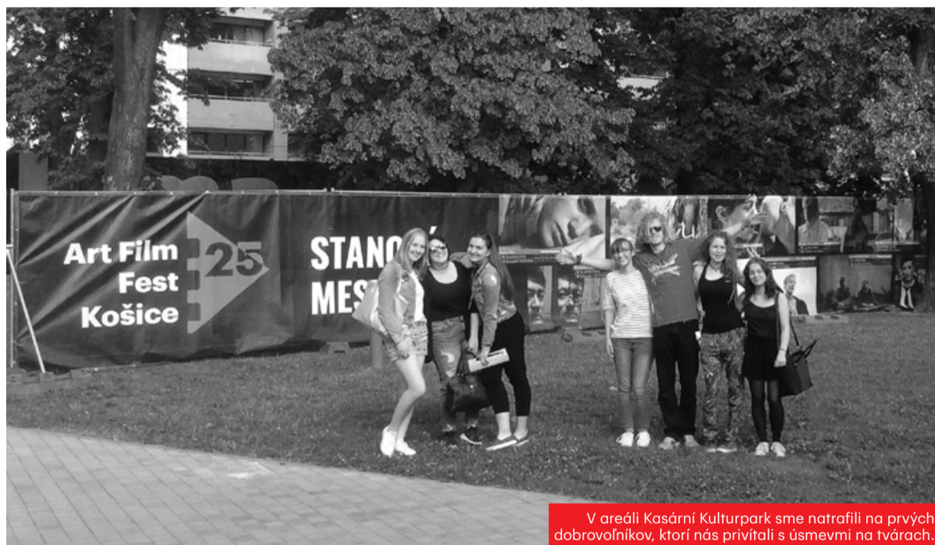
V areáli Kasární Kulturpark sme natrafili na prvých dobrovoľníkov, ktorí nás privítali s úsmevmi na tvárach.