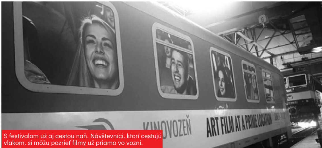
S festivalom už aj cestou naň. Návštevníci, ktorí cestujú vlakom, si môžu pozrieť filmy už priamo vo vozni.