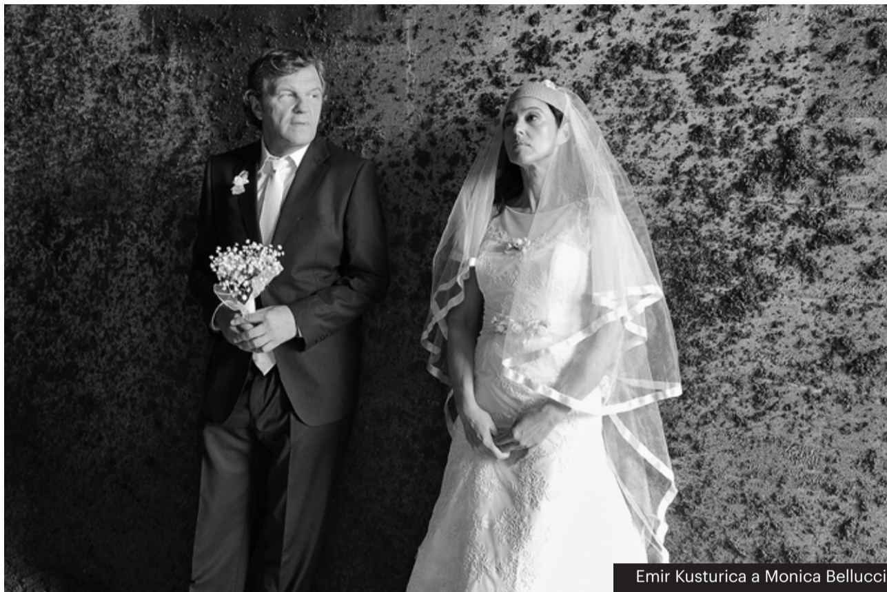
Emir Kusturica a Monica Bellucci

Jedného dňa stretne očarujúcu ženu, ktorá sa ukrýva uprostred zeme nikoho pred zlověstným nápadníkom. Prejde len okamih, kým medzi nimi vzplanie láska. Ju stvárňuje zmyselná talianska herečka Monica Bellucci a jeho samotný Kusturica. „Fyzicky mi to neprekážalo, kondičku mám dobrú. Lenže režisér je dirigent, ktorý všetko harmonizuje a dáva dokopy. A byť chvíľu pred kamerou a potom zase za ňou a pozorovať, mi veľmi nevyhovovalo. Urobil som to po prvýkrát a naposledy,“ priznal sa