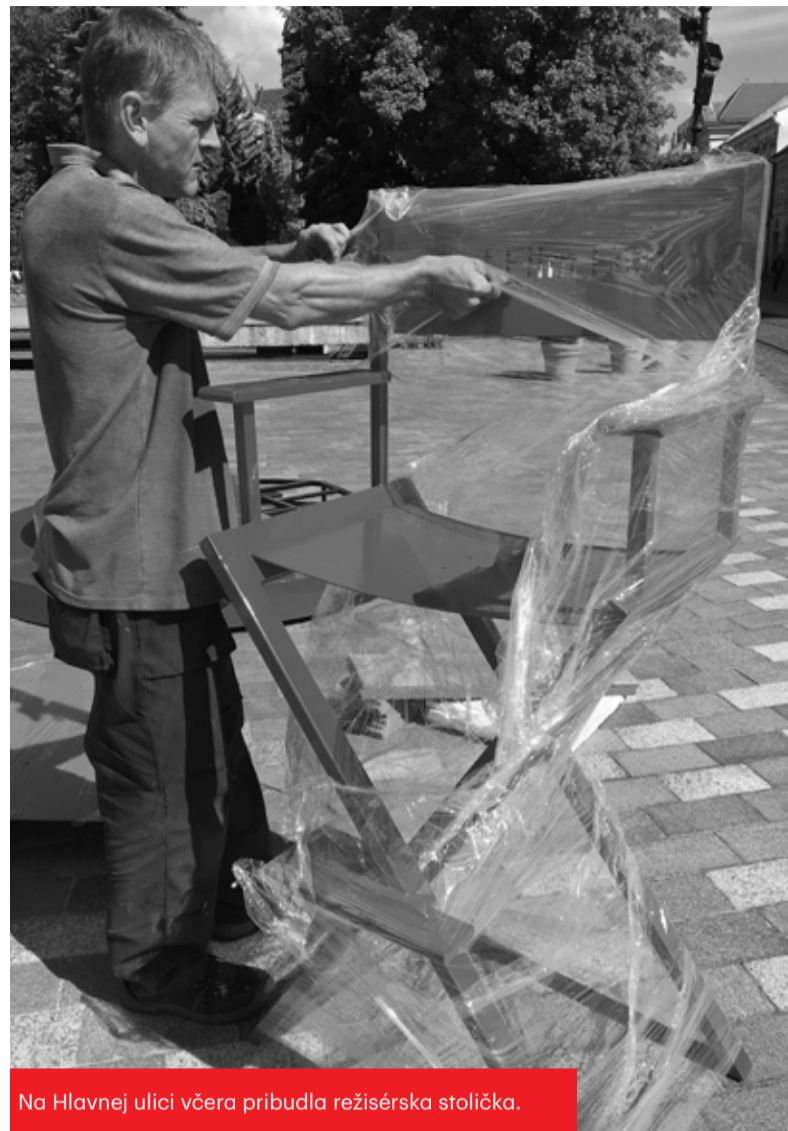
Na Hlavnej ulici včera pribudla režisérská stolička.