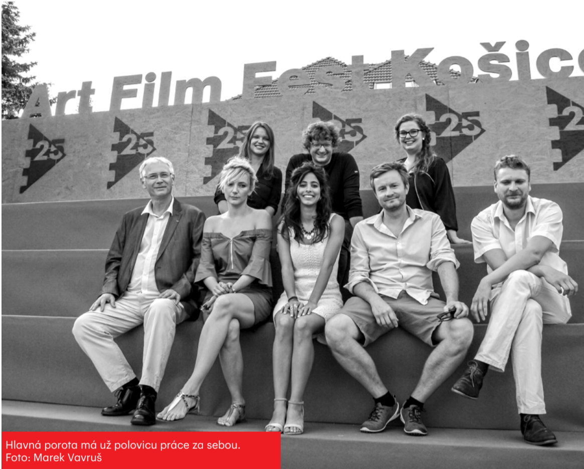
Hlavná porota má už polovicu práce za sebou.