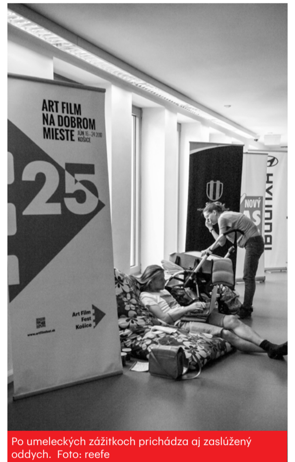
Po umeleckých zážitkoch prichádza aj zaslúžený oddych.