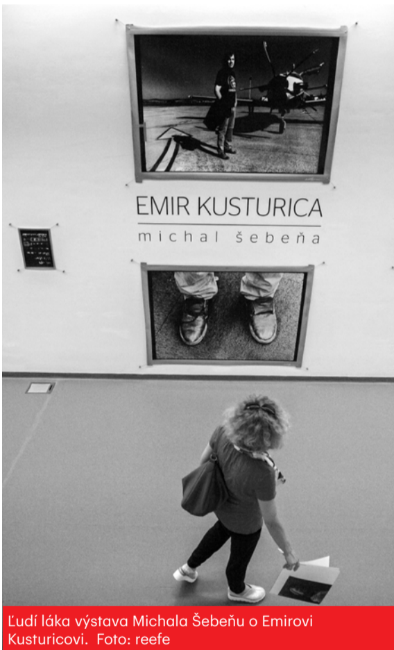
Ľudí láka výstava Michala Šebeňa o Emirovi Kusturicovi.