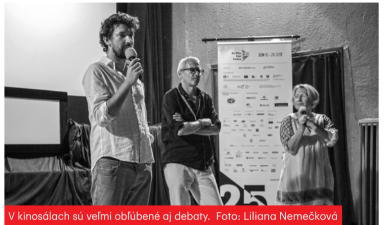
V kinosálach sú veľmi obľúbené aj debaty.