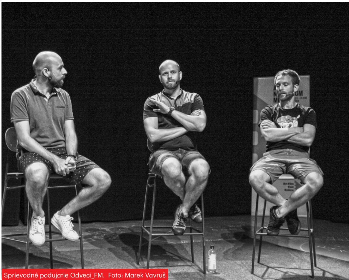
Sprievodné podujatie Odveci_FM.