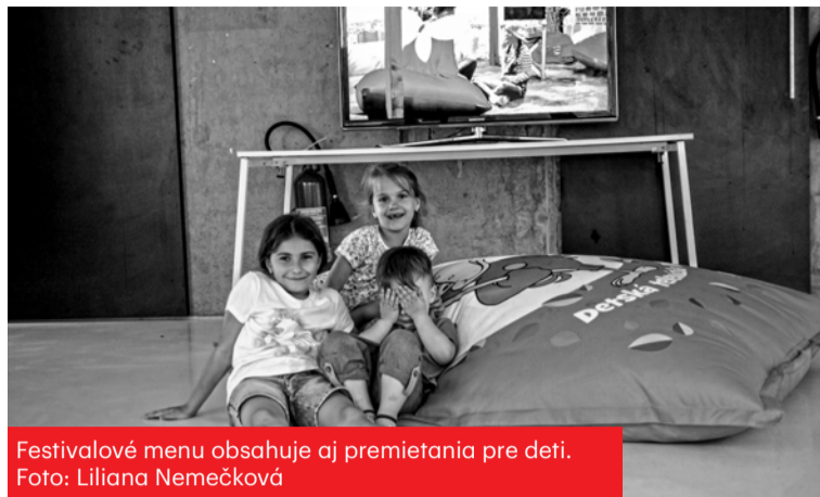
Festivalové menu obsahuje aj premietania pre deti.