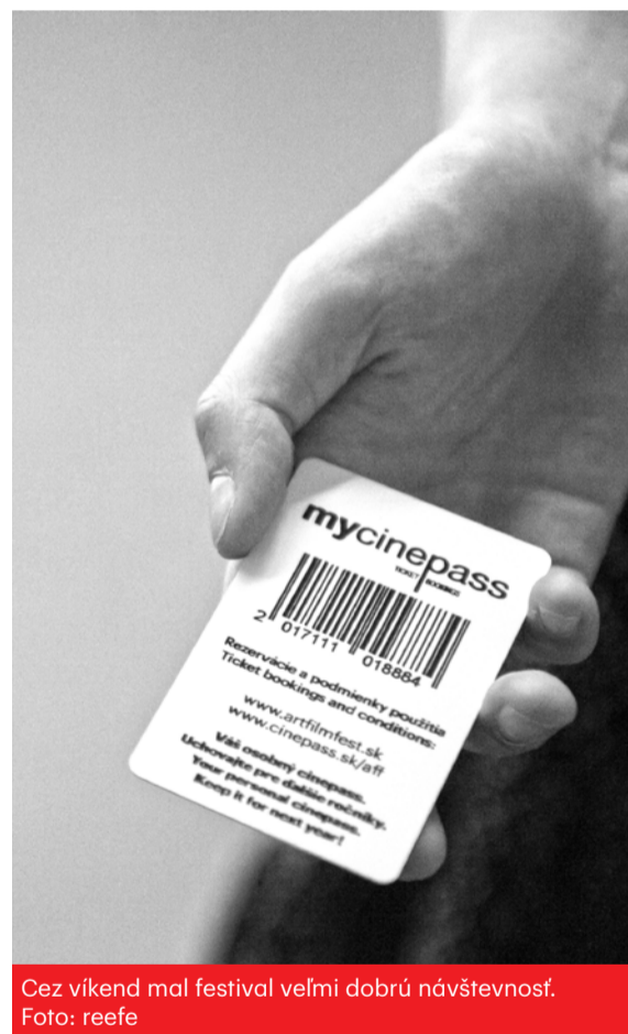
Cez víkend mal festival veľmi dobrú návštevnosť.