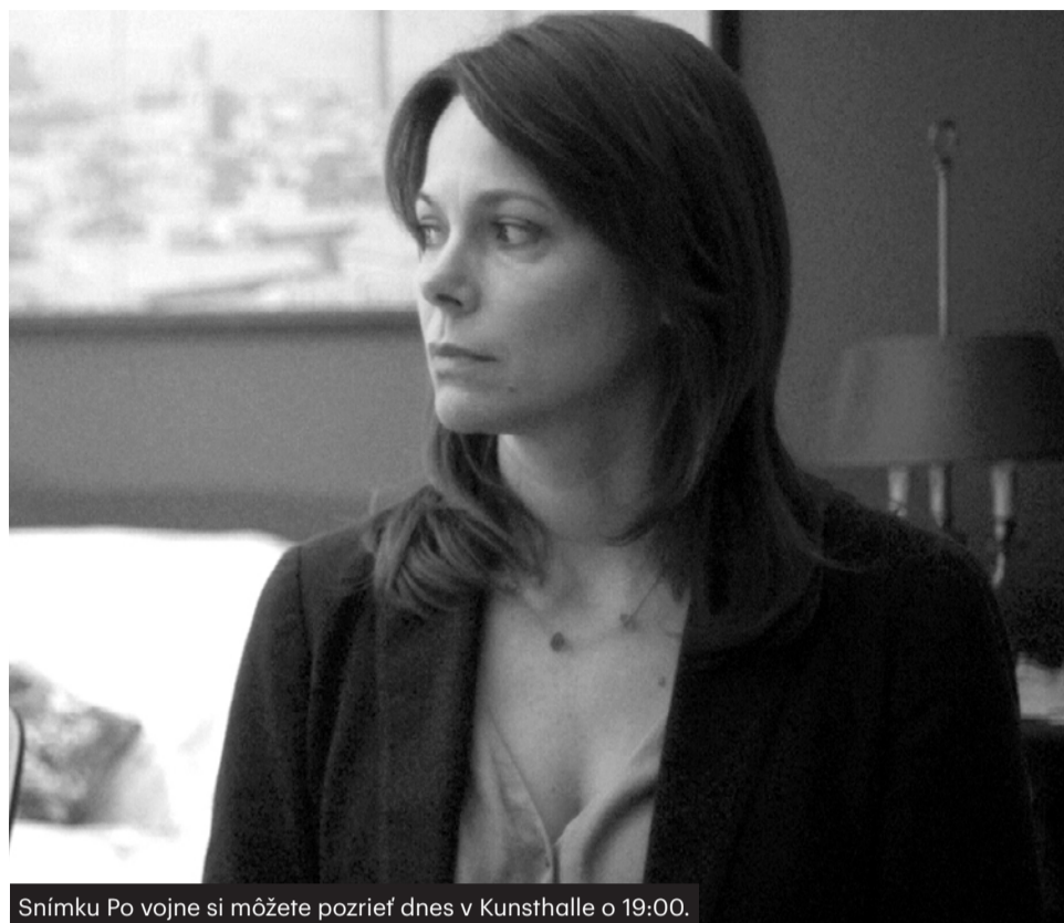
Snímku Po vojne si môžete pozrieť dnes v Kunsthalle o 19:00.