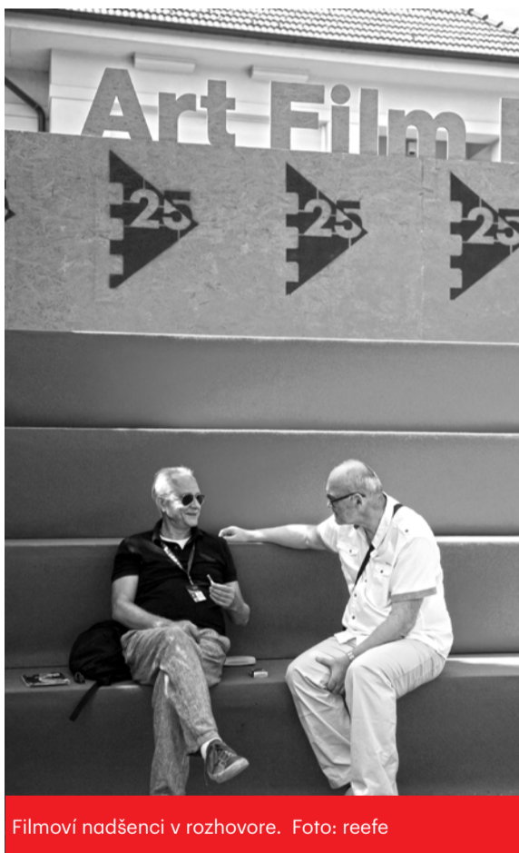
Filmoví nadšenci v rozhovore.