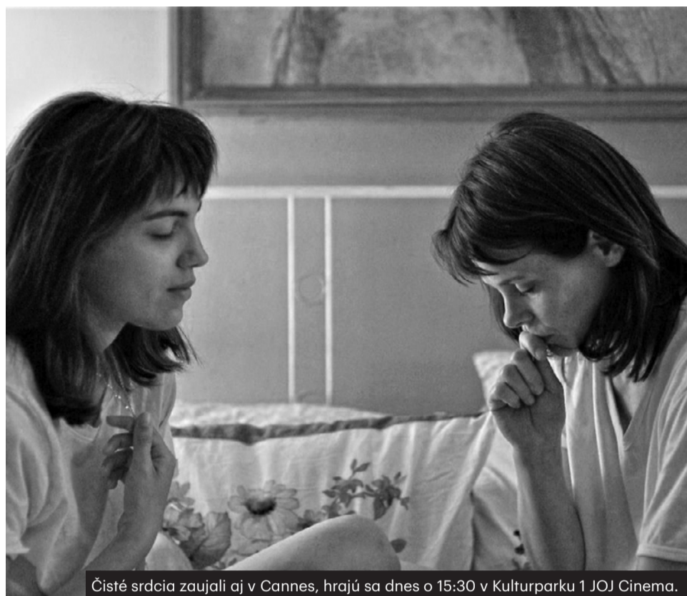
Čisté srdcia zaujali aj v Cannes, hrajú sa dnes o 15:30 v Kulturparku 1 JOJ Cinema.