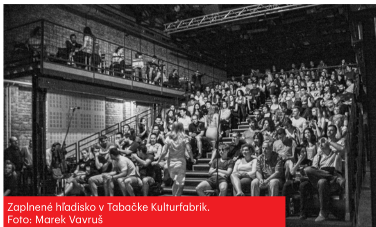
Zaplnené hľadisko v Tabačke Kulturfabrik.