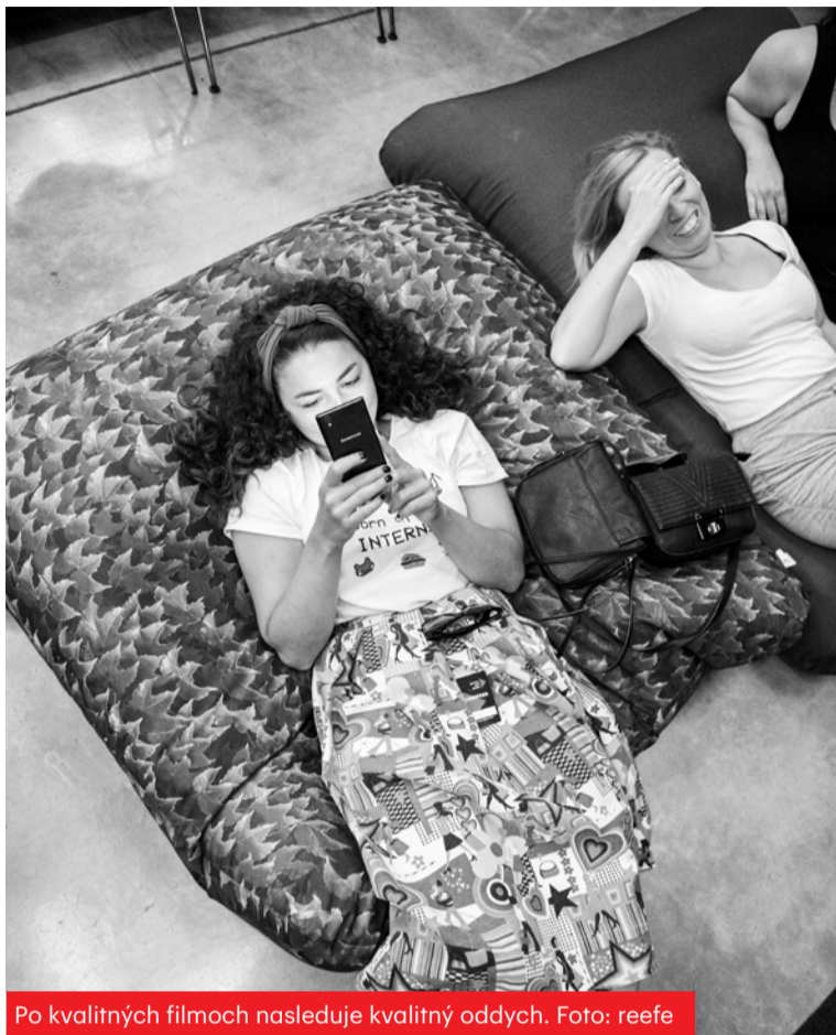
Po kvalitných filmoch nasleduje kvalitný oddych.