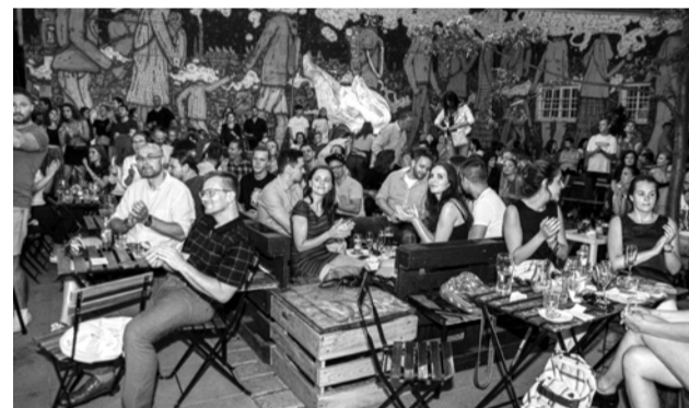
Tabačka bola obľúbenou konečnou zastávkou počas celého festivalu.