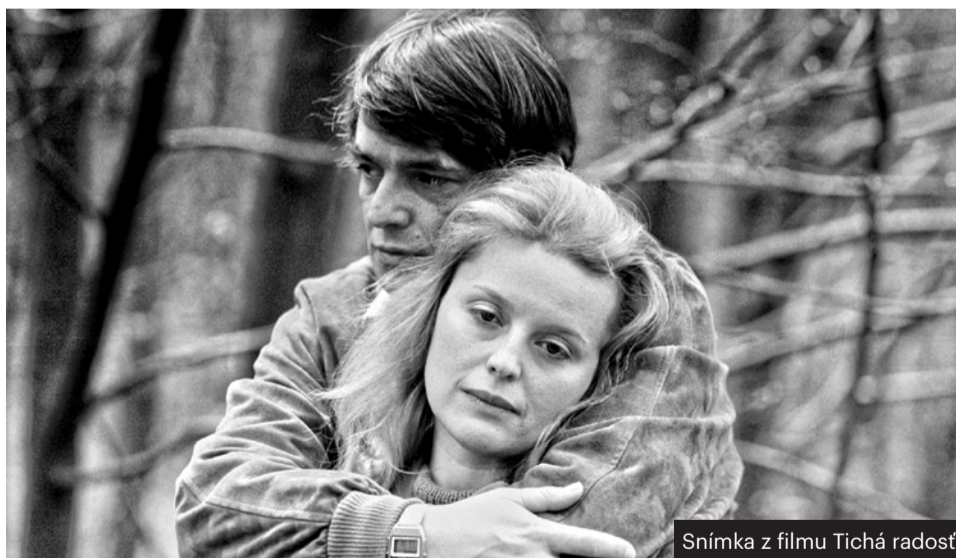
Snímka z filmu Tichá radost

Bolo to pre mňa drastické. Ja som bola konzervatívne dievča z malého mesta a dva roky som prežila v tom divokom filmovom svete.